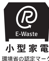
環境省の認定マーク

※3R リデュース Reduce…ごみを減らす リユース Reuse…同じものを何度も繰り返し使うこと リサイクル Recycle…資源として再利用すること