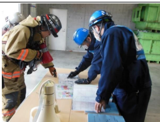
▼消防隊情報提供本部