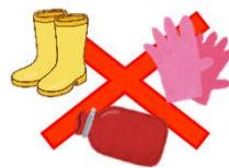
ゴム・シリコン製品