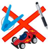
金属を含んだもの