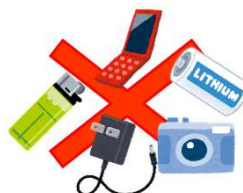
小型家電・ 発火の危険性があるもの