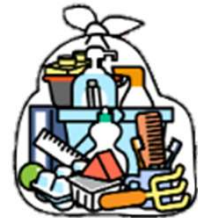
「プラスチック専用袋」 に入れて集積所に出す