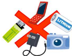
小型家電・ 発火の危険性があるもの