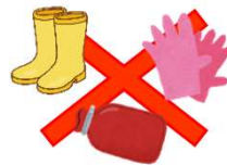
ゴム・シリコン製品