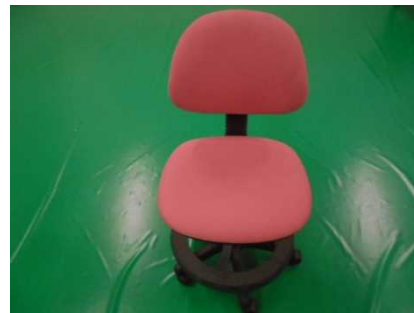
④⑫デスクチェア (ピンク)