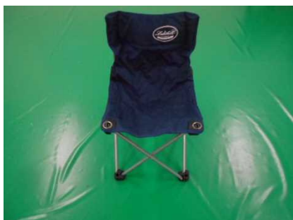
④⑯アウトドアチェア (青)