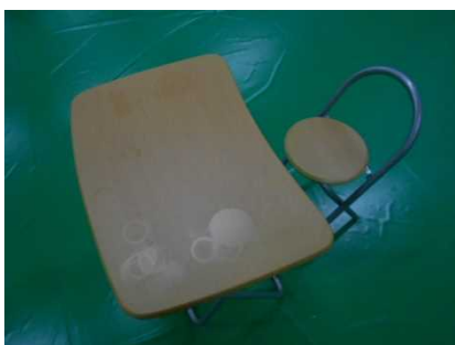
㉔キャリーたたみデスクチェア