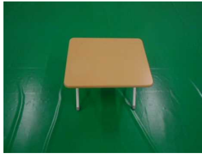
⑬折り畳みテーブル