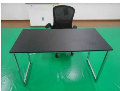
㉑デスクチェアセット