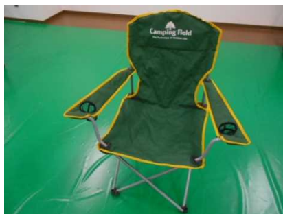
④⑰アウトドアチェア (緑)