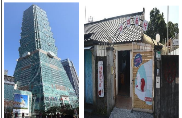
〈写真：左 台北101 右 四四南村〉

本研修で得た視点を今後の業務に活かし、地域の実情に応じた形で、誰もが関わりやすい地域づくりに取り組んでいきたい。